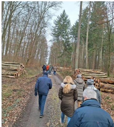
Im Schupbacher Wald

Es war trübe und nasskalt. Dennoch trafen sich am 7. Februar 2025 fast 40 IPA-Freundinnen und Freunde nebst Partner/innen in Beselich-Schupbach. Auch drei Vierbeiner waren mit von der Partie.