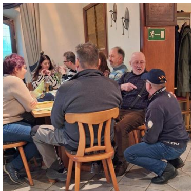
Teile der Gruppe im Gasträum

Pünktlich um 15:30 Uhr startete unsere Gruppe in Richtung Obertiefenbach und der Weg führte ohne größere Steigungen in einem Bogen durch den Wald wieder zurück nach Schupbach. Die ca. fünf Kilometer legten wir in moderatem Tempo zurück, so dass auch die nicht mehr so ganz sportlichen Teilnehmer den Anschluss hielten.