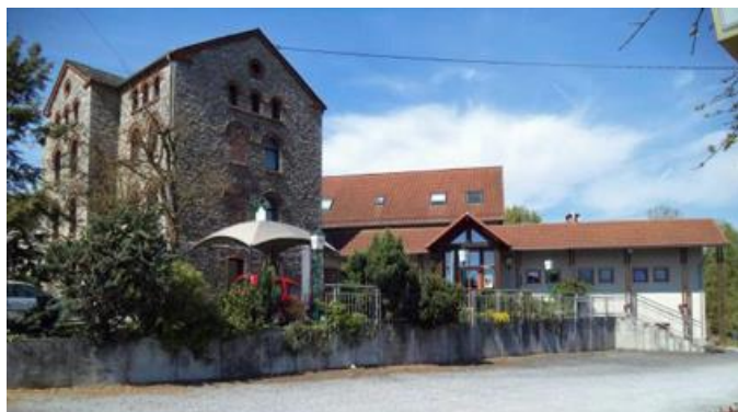
Landgasthof und Hotel Zur Dampfmühle